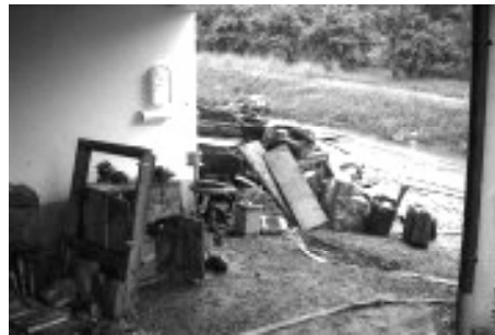
Sandsäcke stapeln alleine reicht nicht. Im Kampf gegen das Hochwasser sind gute Konzepte gefragt!

möglichst rasch verteilen kann und sich kein Rückstau bis in unsere Keller bildet. So werden wir auch in Zukunft unsere Keller sinnvoll nutzen können und müssen nicht jeden Sommer die Einrichtung und die gelagerten Sachen zum Sperrmüll bringen.