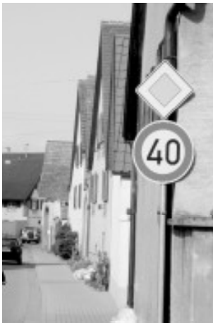
Tempo 40 in der Langgasse - nur eines der langfristig verfolgten und erreichten Ziele der SPD- Offenen Liste Merdingen.

Über Jahre plätscherte das Thema „Verkehrsberuhigung/ Überweg Langgasse“ so vor sich hin. Erst als sich die Elternbeiräte von Kindergarten und Schule sowie der Förderverein für eine Lösung einsetzten, kam Bewegung in die Problematik.