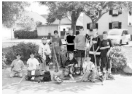
Einige der Jungs vom 1. Merdingener Hockey-Club. Unterstützenswertes Bürgerengagement ist in Merdingen keine Frage des Alters

Mitgliedsbeiträgen einiges an Ausrüstung angeschafft. Die war vor allem für die Torwarte wichtig, die bereits ganz ordentlich mit Helm und Gesichtsschutz ausgestattet sind. Die zerlegbaren Tore werden zu Beginn des Nachmittags mitgebracht und am Abend wieder mitgenommen. Stolz zeigt einer der älteren Jungs den Ordner vor, in dem die erste Vorstandsschafft des Clubs protokolliert ist. Vier