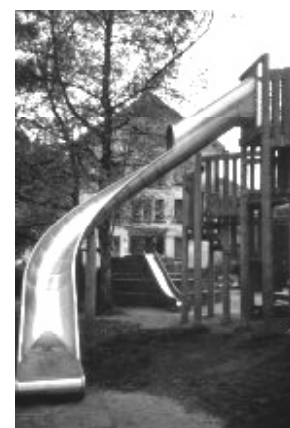
Diese Rutsche dient dem Kindergarten in Zell unter anderem als Notausgang aus dem Obergeschoss - vielleicht auch eine Lösung für das Merdinger Kindergartenobergeschoss?

Wir teilen diese Befürchtungen nicht und unterstützen sowohl den Zuzug einer ELZE-Gruppe als auch die Gründung einer Waldspielgruppe in Merdingen - genügend Bedarf gibt es für beide.